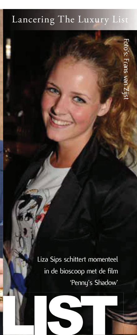
Lancering The Luxury List