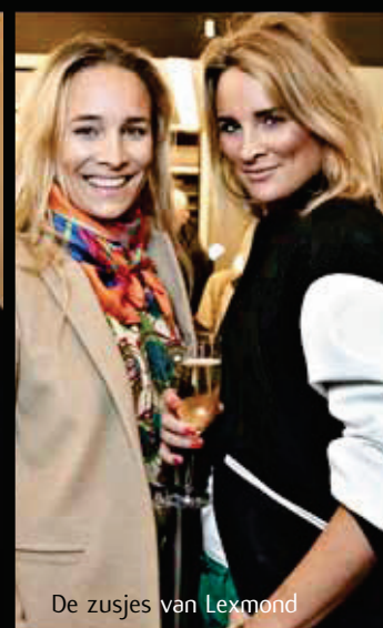
De zusjes van Lexmond