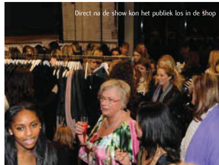
Direct na de show kon het publiek los in de shop