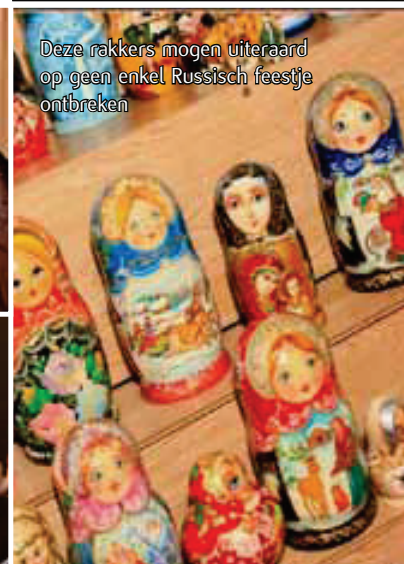
Deze rakkers mogen uiteraard op geen enkel Russisch feestje ontbreken