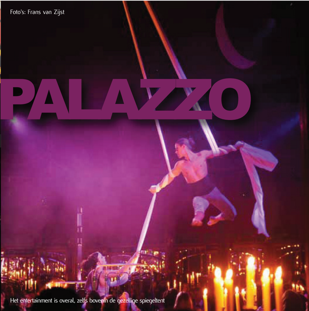
Het entertainment is overal, zelfs bovenin de gezellige spiegeltent

Het prachtige diner spektakel is voor het tweede jaar op rij neergestreken naast het Amsterdamse Bijlmer station. Niet de meest glamoureuze plek van Nederland, maar eenmaal binnen waan je jezelf in een bijzonder sfeervol, droomachtig paleisje.