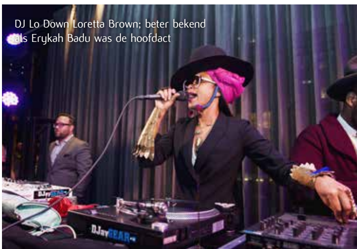
DJ Lo Down Loretta Brown; beter bekend als Erykah Badu was de hoofdact