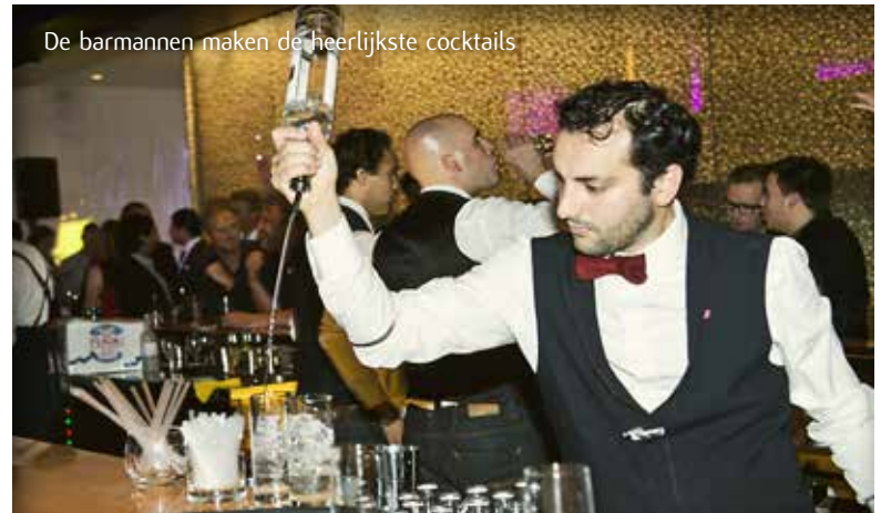
De barmannen maken de heerlijkste cocktails