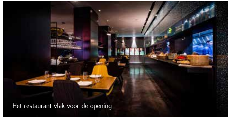
Het restaurant vlak voor de opening

En met een knal bedoelen een ongelooflijk knalfeest. Werkelijk alles werd op alle gebieden uit de kast getrokken! Genodigden werden voorzien van hapjes en cocktails van de inspannende lifestyle venue 5&33. De art gallery van het hotel had ook een primeur die avond en lanceerde samen met Atelier Van Lieshout - tevens huiskunstenaar van art'otel - officieel haar eerste expositie.