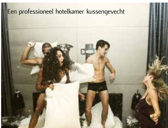
Een professioneel hotelkamer kussengevecht