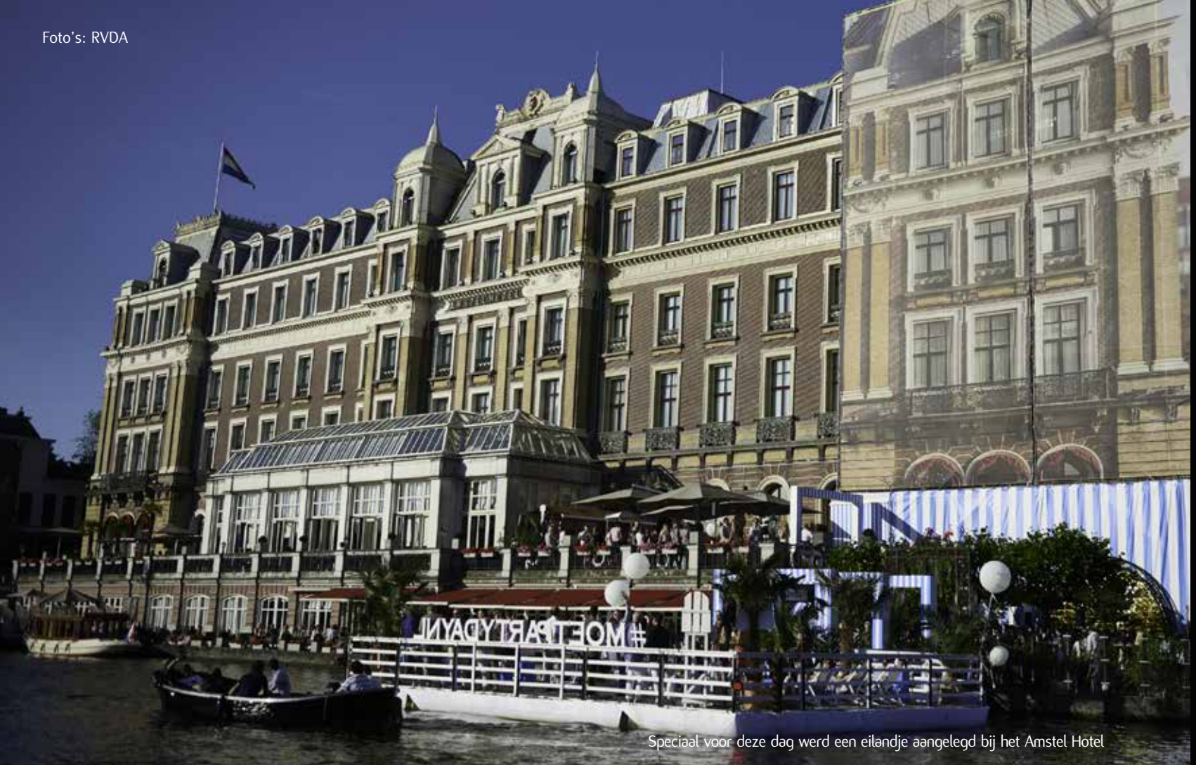
Speciaal voor deze dag werd een eilandje aangelegd bij het Amstel Hotel