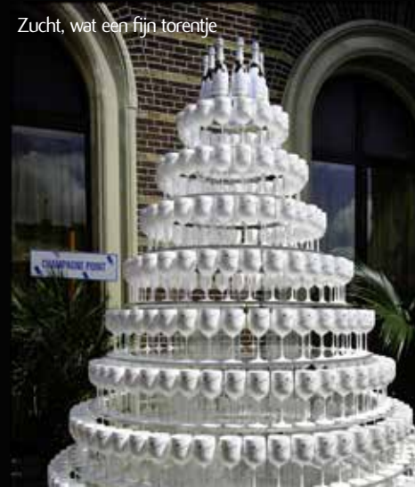
Zucht, wat een fijn torentje