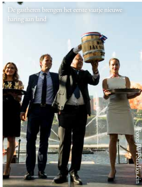
De gastheren brengen het eerste vaatje nieuwe haring aan land

Zo'n 750 gasten uit de (Amsterdamse) zakenwereld, kunst en cultuur, media, horeca, mice en reisbranche genoten van de nieuwe haring.