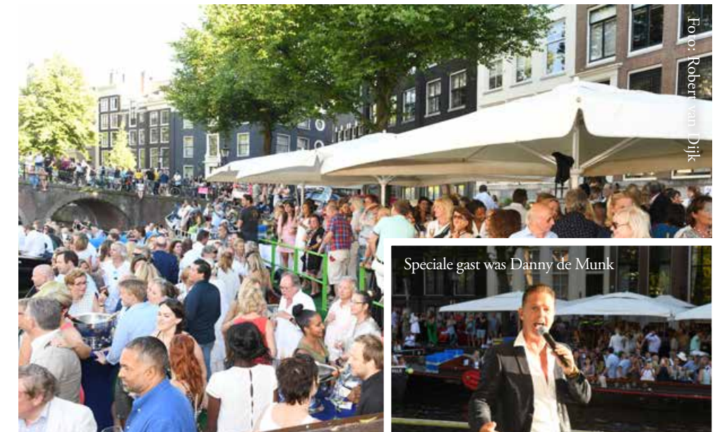
Speciale gast was Danny de Munk