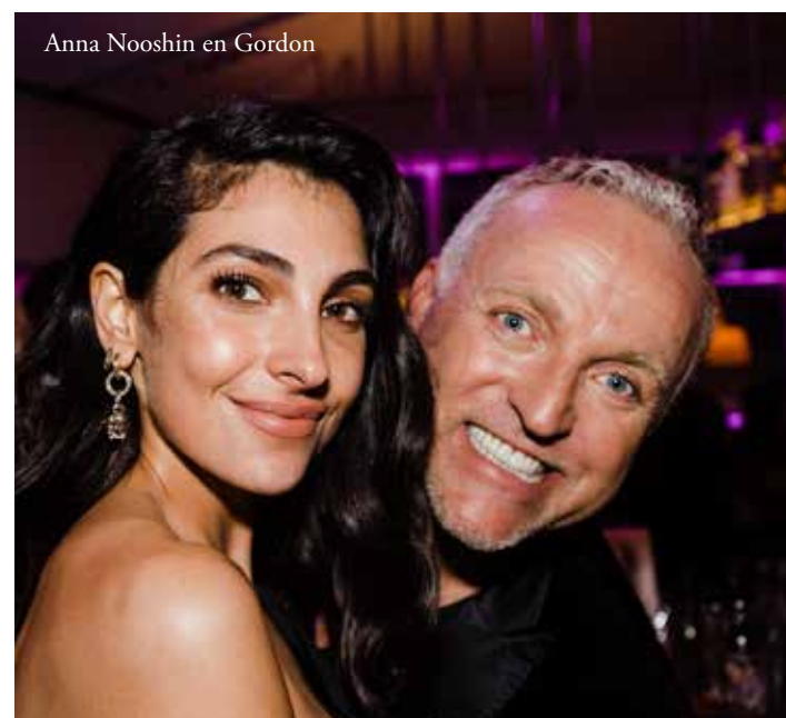
Anna Nooshin en Gordon