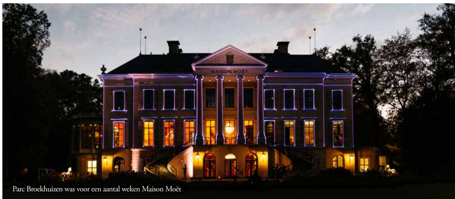
Parc Broekhuizen was voor een aantal weken Maison Moët