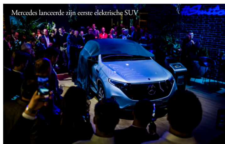
Mercedes lanceerde zijn eerste elektrische SUV